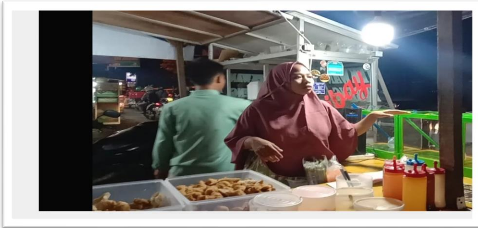
Karawang,31 Maret 2023