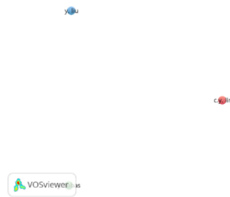
Gambar 2. Hubungan Co-Authorship

Berdasarkan gambar 2 di atas, dapat disimpulkan bahwa tidak terdapat hubungan antara satu penulis dengan penulis lainnya yang membahas tema tentang budaya organisasi. Hasil analisis menunjukkan bahwa tidak ada hubungan dalam pemahaman atau penelitian budaya organisasi periode 2019-2023. Meskipun tidak ditemukannya hubungan yang signifikan, penting untuk mengakui keterbatasan analisis seperti keterbatasan data yang mencakup keterbatasan dalam cakupan sumber data serta keterbatasan metodologis yang mencakup metode pengindeksan atau pencarian yang digunakan. Penelitian ini juga menunjukkan perlunya pendekatan yang lebih holistic dalam memahami budaya organisasi dan perlunya penelitian lebih lanjut untuk mengeksplorasi faktor-faktor yang mungkin mempengaruhi keragaman dalam literature tentang topik ini.