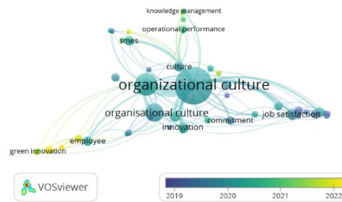
Gambar 4. Visualisasi Co-Occurrence (overlay)

Visualisasi co-occurrence (overlay) menjelaskan pola dan tren penelitian sesuai dengan tema penelitian yaitu budaya organisasi. Jika hasilnya menunjukkan banyak kelompok ungu dan biru, waktu penelitian akan lebih lama. Disisi lain, jika hasilnya menunjukkan bahwa ada banyak kelompok hijau dan bahkan kuning, maka waktu penelitian kemungkinan akan menjadi baru. Gambar 4 menunjukkan bahwa penelitian dengan tema budaya organisasi sudah menjadi topik yang banyak diteliti. Hal ini ditunjukkan dengan dimasukkannya budaya organisasi dalam kelompok biru. Adapun table dibawah ini yang menunjukkan sepuluh artikel akses terbuka dengan kutipan terbanyak.