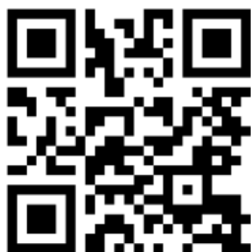
Gambar 13. Barcode Output Video

Hasil perancangan dari semua proses panjang yang dilakukan adalah mengunggah file video ke media sosial ULBI, seperti Instagram, TikTok dan Youtube.