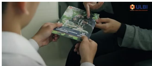
Gambar 7. Membranding Beasiswa 10 Miliar di ULBI

Adegan tersebut menerangkan bahwa ULBI memiliki beasiswa hingga 10 miliar. Karena perancangan video ini dikhususkan untuk calon mahasiswa baru, tentunya tim produksi selalu berusaha untuk menyisipkan merek ULBI dalam setiap konten yang dibuatnya.