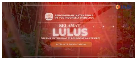
Gambar 8. Membranding Ikatan Dinas PT. Pos Indonesia (Persero)

Ikatan Dinas PT. Pos Indonesia menjadi adegan terpenting dalam pembuatan film pendek documenter ini, karena memang sosok nyata (Petra) yang berhasil lolos dalam seleksi Ikatan Dinas PT. Pos Indonesia Angkatan tahun 2022 atau Angkatan ke-25 dalam seleksi tersebut.