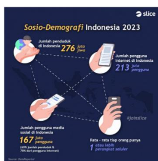
Gambar 1. Sosio Demografi Indonesia 2023

Perancangan ini berjudul, Perancangan Video Branding ULBI Menggunakan Film Pendek Dokumenter Melalui Media Sosial. Menggunakan Film Pendek Dokumenter karena diangkat dari kisah nyata yaitu menceritakan tentang seorang anak muda tentunya salah satu alumni ULBI yang berasal dari Sumatera Utara dan terlahir dari keluarga yang sederhana dan memiliki kekurangan namun penuh perjuangan serta memiliki tekad kuat untuk melanjutkan Pendidikan ke jenjang yang lebih tinggi. Kondisi saat ini sedang terjadi di ULBI sebagai merek pendidikan baru dari penggabungan POLTEKPOS dan STIMLOG yaitu membutuhkan iklan yang konsisten demi memperkenalkan merek baru meskipun tentunya akan asing di kalangan masyarakat tetapi hal tersebut bukan hambatan, salah satu bentuk memperkenalkan merek baru adalah dengan membuat iklan video karena di jaman sekarang masyarakat lebih mudah mendapatkan informasi terbaru dari media sosial.