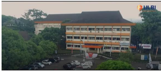
Gambar 10. Membranding Gedung dan Lokasi Kampus ULBI

Kampus ULBI yang menjadi saksi bisu tempat belajarnya sosok Petra yang tak luput dari sisi branding dalam perancangan video ini. Diperlihatkan sudut pandang dari udara menggunakan drone Gedung Rektorat lengkap dengan tulisan Universitas Logistik dan Bisnis Internasional.