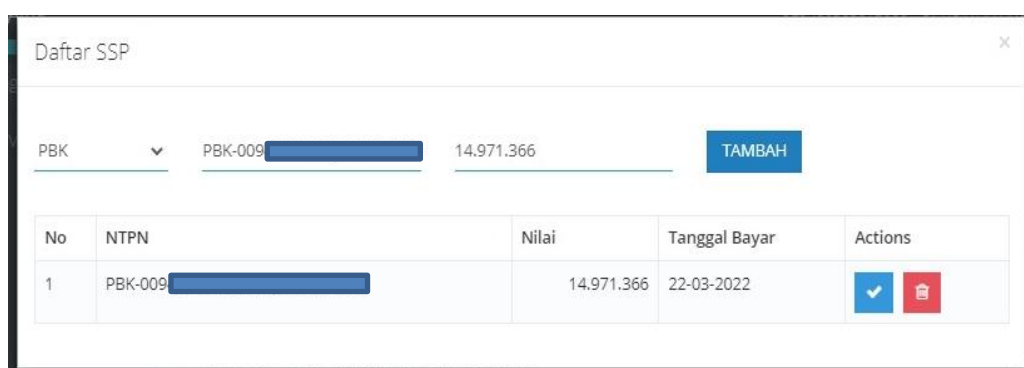
Gambar 3. Pelaporan SPT Masa PPN akibat Pemindahbukuan

Pelaporan SPT Masa PPN wajib untuk dilaporkan meskipun tidak terdapat transaksi yang dilakukan. Untuk melakukan pelaporan SPT Masa PPN 1111 tidak perlu lagi melakukan create file CSV dari aplikasi e-faktur. Tetapi pelaporan langsung melewati web e-faktur dengan laman https://web-efaktur.pajak.go.id setelah pajak keluaran dibuat dan pajak masukan di upload melalui aplikasi e-faktur seperti yang telah dijelaskan diatas. Dalam masa Februari 2022 PT. RA melakukan pemindahbukuan (Pbk). Sehingga langkah yang dilakukan PT. RA yaitu memasukkan nomor PBK dan nilai nominal yang telah disetor lalu klik tambah.