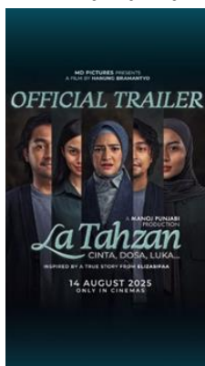
Gambar 1. Poster Film La Tahzan: Cinta, Dosa, Luka

Dibalik kesuksesan film La Tahzan: Cinta, Dosa, Luka yang ditampilkan di layar lebar dan tayang di seluruh Indonesia tidak lepas dari kerja keras seorang sutradara. Keberhasilan penanyangan film ini juga merupakan bagian dari tanggung jawab sutradara, maka dari itu peran dan tanggung jawab seorang sutradara juga dibutuhkan terhadap hasil akhir baik secara audio maupun visual. Sutradara merupakan seseorang yang menciptakan ide yang masih berbentuk tulisan menjadi sebuah bentuk visual, Sam Sarumpaet (dalam Dennis, 2008). Film ini menampilkan cerita yang diadaptasi dari kisah nyata seseorang yang pertama kalinya diceritakan oleh pengguna Tik Tok @elizasifa, kemudian diangkat menjadi film layar lebar dengan disutradarai Hanung Bramantyo. Melalui cerita ini, ideologi patriarki yang muncul dalam masyarakat Indonesia tergambar jelas melalui dinamika hubungan keluarga dan penindasan terhadap gender.