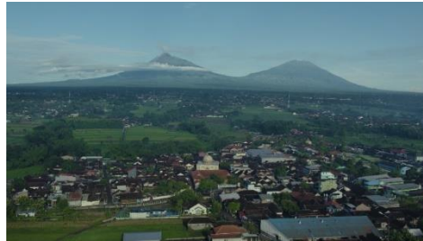
Gambar 1: Suasana Desa pagi hari

Pada Gambar 1 terlihat keindahan Desa Janti di pagi hari. Gunung yang menjulang, sawah hijau, dan rumah-rumah warga menciptakan suasana yang tenang dan asri, menggambarkan kehidupan pedesaan yang damai..