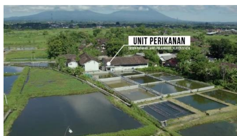
Gambar 8: Visual Dari Unit Perikanan

Pada Gambar 8 ditampilkan unit Perikanan memperlihatkan lokasi dan luas area perikanan sebagai salah satu potensi desa yang dikelola. Unit ini memiliki sekitar 20 kolam yang digunakan untuk proses budidaya ikan. Setiap kolam difungsikan sesuai dengan tahapan pertumbuhan ikan, mulai dari pembenihan hingga pembesaran, sehingga prosesnya lebih teratur dan hasilnya optimal.