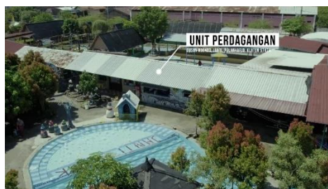
Gambar 7: Visual Dari Unit Perdagangan

Pada Gambar 7 ditampilkan unit Perdagangan yang berada di kawasan Destinasi Wisata Janti Park. Unit ini memiliki tiga titik warung yang semuanya dikelola untuk melayani kebutuhan para pengunjung. Keberadaan unit perdagangan ini tidak hanya mendukung kenyamanan wisatawan yang datang, tetapi juga menjadi salah satu sumber penggerak ekonomi desa. Hal ini menunjukkan bahwa BUMDesa Jaya Janti tidak hanya menjadi tempat rekreasi, tetapi juga pusat kegiatan ekonomi masyarakat sekitar.