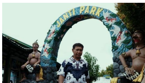
Gambar 3: Direktur BUMDesa Jaya Janti sedang berjalan