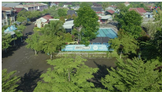
Gambar 12: Visual dari Janti Park

Pada Gambar 25 merupakan Scene Penutup dan menampilkan Janti Park dari halaman parkir, di sini menunjukkan Direktur BUMDesa Jaya Janti terharu dengan apa yang sudah dicapai BUMDesa Jaya Janti selama ini.