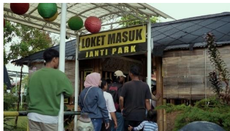
Gambar 2: Suasana Locket masuk Janti Park

Pada Gambar 2 terlihat suasana di depan loket masuk Janti Park yang dipenuhi oleh pengunjung. Beberapa orang tampak sedang mengantre untuk membeli tiket masuk, menunjukkan betapa ramainya tempat wisata ini. Locket yang sederhana namun tertata rapi menjadi titik awal sebelum para pengunjung menikmati berbagai wahana dan keindahan yang ada di dalam Janti Park.