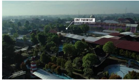
Gambar 6: Visual Unit Pariwisata

Pada Gambar 6 ditampilkan visual animasi yang memperlihatkan lokasi unit Pariwisata beserta penandanya. Unit Pariwisata yang dimaksud adalah Janti Park, yang menjadi salah satu daya tarik utama di Desa Janti. Animasi ini membantu penonton memahami dengan jelas di mana unit Pariwisata tersebut berada serta suasana lingkungan di sekitarnya.