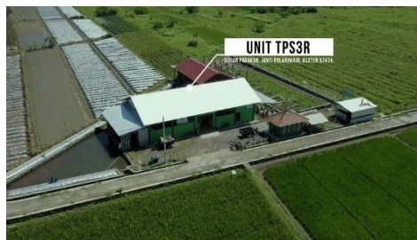
Gambar 10: Visual Dari Unit TPS3R

Pada Gambar 10 menampilkan unit Tempat Pengolahan Sampah Reduce, Reuse, Recycle (TPS3R), unit TPS3R tidak hanya berkontribusi dalam menjaga kebersihan lingkungan, tetapi juga membantu mengubah sampah menjadi sumber daya yang lebih bernilai.