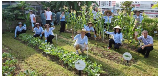
Gambar 5. Khoo Teck Puat Hospital: Community-Centric Approach

Setiap ruang pasien menghadap ke luar dengan jendela lebar yang membuka ke pemandangan taman atau kolam. Ruang tunggu dan koridor didesain seperti veranda dengan pencahayaan alami dan aliran udara segar. Penggunaan material alami seperti kayu dan batu memberikan sentuhan hangat dan manusiawi pada suasana rumah sakit.