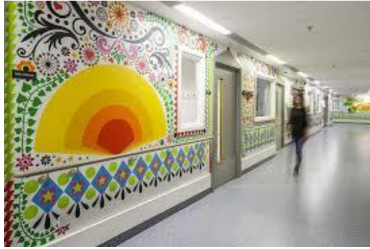
Gambar 12. 15 Artists Collaborate To Make London Children’s Hospital Cozier For Kids

Dominasi warna hangat seperti merah, oranye, dan kuning yang membentuk gambar matahari, dikombinasikan dengan elemen flora berwarna hijau dan biru, menciptakan suasana ceria, ramah, dan menyenangkan. Keberadaan seni pada dinding rumah sakit seperti ini berfungsi sebagai bagian dari penerapan healing environment , khususnya dalam aspek seni visual (arts). Tujuan utamanya adalah mengurangi kecemasan, meningkatkan suasana hati pasien, dan menciptakan lingkungan yang lebih humanis dan tidak kaku. Seni visual ini juga menjadi media distraksi positif yang dapat membantu pasien, terutama anak-anak dan pasien geriatri, merasa lebih tenang saat menjalani proses perawatan. Bagi pengunjung dan staf medis, suasana koridor yang estetik dan penuh warna juga meningkatkan kenyamanan dan semangat kerja, sehingga berdampak baik terhadap kualitas pelayanan.