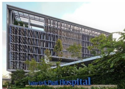
Gambar 1. Singapore's Khoo Teck Puat Hospital

Konsep healing environment menjadi sangat relevan dalam rumah sakit modern yang tidak hanya menjadi tempat perawatan medis, namun juga sebagai ruang penyembuhan holistik. Terutama dalam menghadapi tantangan rumah sakit perkotaan yang memiliki kepadatan tinggi, keterbatasan lahan, serta tekanan lingkungan yang tinggi, konsep ini menjadi jawaban atas kebutuhan akan ruang yang tidak hanya fungsional tetapi juga suportif terhadap proses penyembuhan manusia. Berbagai penelitian menyatakan bahwa pasien yang dirawat di ruang dengan pencahayaan alami dan akses terhadap pemandangan luar mengalami perbaikan kesehatan yang lebih cepat dibanding pasien yang berada di ruang tertutup tanpa akses visual ke lingkungan (Azizah & Anita, 2022).