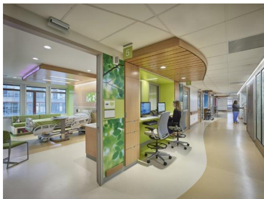
Gambar 9. Children's Hospital of Philadelphia, Medical Behavioral Unit

Desain yang bebas hambatan (aksesibel) memungkinkan mobilitas mudah bagi semua pengguna, termasuk penyandang disabilitas. Transisi antara ruang luar dan dalam diolah secara halus dan alami melalui elemen seperti kanopi, pintu geser transparan, atau semi-outdoor spaces .