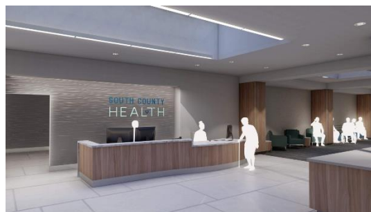
Gambar 11. Hospital Main Entrance/Lobby Upgrades - Phase 2

Desain pintu masuk utama menciptakan kesan pertama yang menenangkan dan menyambut. Zona ini biasanya didukung oleh lanskap hijau, signage yang jelas, dan area tunggu yang nyaman untuk meredakan kecemasan awal pengunjung.