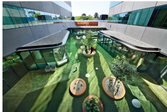
Gambar 6. Royal Children's Hospital landscape

Suasana rumah dihadirkan melalui desain interior yang hangat, pemilihan furnitur non-klinis, pencahayaan lembut, serta skala ruang yang nyaman. Tujuannya adalah mengurangi kesan institusional dan memberikan rasa aman serta familiar bagi pasien.