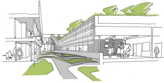
Gambar 11. HENN and C.F. Møller Architects Win International Competition

Fasilitas ini berupa lintasan pedestrian yang mengelilingi area taman utama dan terhubung dengan berbagai titik relaksasi seperti taman aromaterapi dengan tanaman beraroma menenangkan (lavender, serai, mint), gazebo yang nyaman untuk keluarga pasien, dan ruang refleksi spiritual yang tenang. Jalur ini tidak hanya berfungsi sebagai sarana olahraga ringan bagi pasien dalam masa pemulihan, tetapi juga sebagai media terapeutik yang merangsang indera dan emosi secara positif. Bagi staf medis dan keluarga pasien, healing trail menjadi tempat beristirahat sejenak dari rutinitas yang padat dan emosional. Konsep ini menegaskan pentingnya dukungan psikososial dalam sistem pelayanan kesehatan modern, menciptakan ruang interaksi yang humanis, kontemplatif, dan sehat secara alami. Jalur ini menjadi simbol integrasi antara fungsi medis dan keseimbangan jiwa.