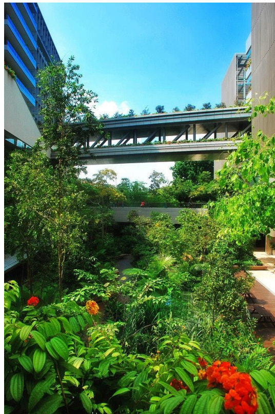
Gambar 3. Singapore's Khoo Teck Puat Hospital: Biophilic Design in Action

Gambar ini merupakan representasi arsitektural dari Rumah Sakit Khoo Teck Puat (KTPH) di Singapura yang mengusung konsep healing environment . Komposisi bangunan tersusun dalam blok-blok linier yang membentuk ruang terbuka tengah (courtyard) sebagai pusat aktivitas alami dan visual. Setiap bangunan memiliki atap hijau dan sistem ventilasi silang yang menunjang kenyamanan termal secara pasif. Elemen air hadir di tengah tapak melalui kolam reflektif dan taman basah yang memperkuat efek terapeutik serta mengatur mikroklimat sekitar. Akses pejalan kaki dan jembatan penghubung mengintegrasikan zona-zona pelayanan dalam alur sirkulasi yang efisien dan nyaman. Pepohonan dan vegetasi tropis tersebar merata di seluruh area, menciptakan hubungan visual dan fungsional antara bangunan dan alam. Desain ini menunjukkan pendekatan holistik yang menyatukan fungsi medis, keberlanjutan, dan kesejahteraan psikologis pasien. Gambar ini menjadi referensi penting dalam merancang rumah sakit umum berkonsep penyembuhan alami di iklim tropis seperti Semarang.