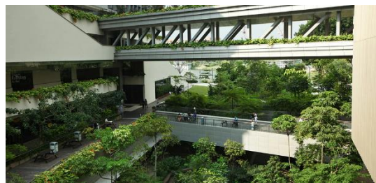
Gambar 7. Singapore Global Network

Akses visual maupun fisik ke elemen alam, seperti taman, pepohonan, kolam, dan langit terbuka, terbukti secara ilmiah dapat mempercepat proses penyembuhan, mengurangi stres, dan meningkatkan kualitas tidur pasien.