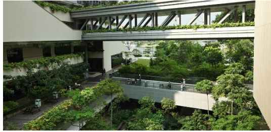
Gambar 4. Singapore Global Network