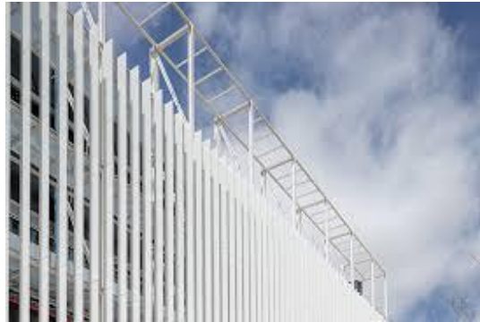
Gambar 8. Area polivalente dell'ospedale Moisès Broggi

Penerangan alami yang memadai dari bukaan dan skylight, dikombinasikan dengan pencahayaan buatan yang hangat dan tidak menyilaukan, dapat mendukung ritme sirkadian pasien, mengurangi kecemasan, dan meningkatkan mood.